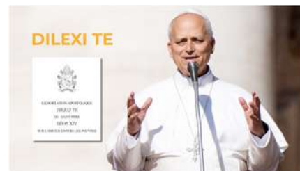
Cinq mois après son élection, Léon XIV a publié sa 8 exhortation apostolique de son pontificat, Dilexi Te, sur l'amour envers les pauvres.